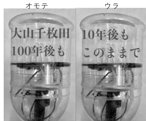
メッセージ見本 2段で20-25文字程度が適当です