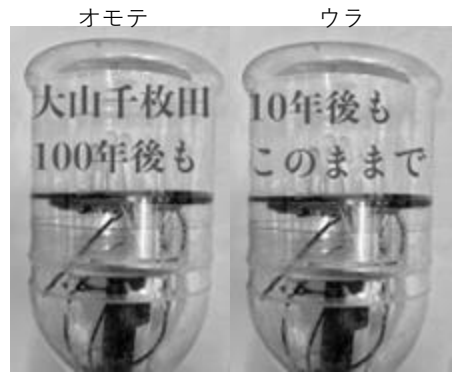
メッセージ見本 2段で20-25文字程度が適当です