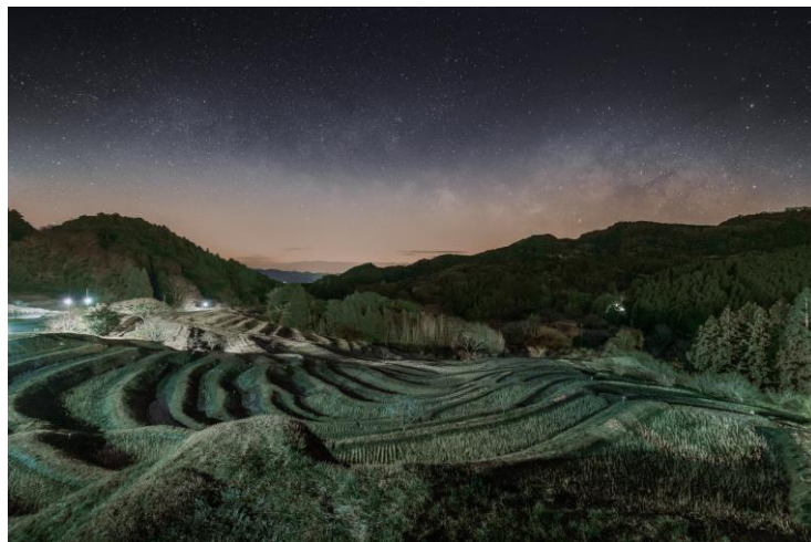
2023 最優秀賞「静寂に目覚める」平林 真樹

日本の棚田百選に選ばれた大山千枚田の四季折々の情景を被写体として、棚田にあふれるいのちを表現したもの。また1月から12月まで年間を通じてカレンダーとして観光宣伝に効果のあるもの。