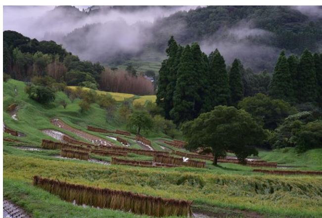
2023 優秀1「棚田の恵み」鎌田 安博